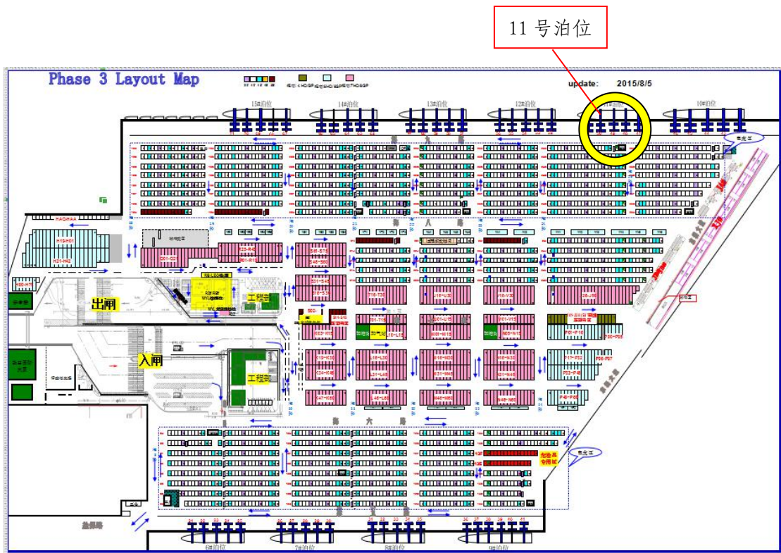
图 2 盐田三期码头平面示意图