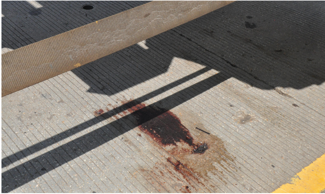
图 6 现场痕迹（血迹）