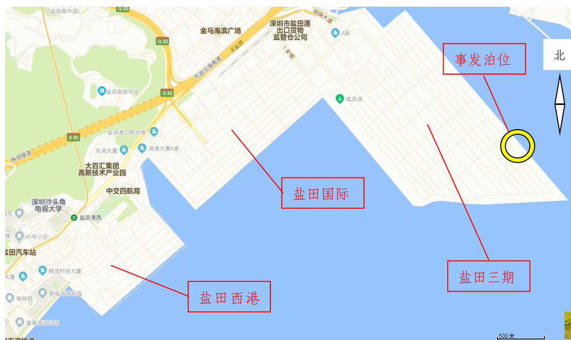
图 1 盐田港集装箱码头平面位置图

码头由初建的 5 个泊位，扩展到现在的 20 个泊位，形成了由以上三个独立的有限公司组成的盐田港码头集装箱装卸（堆场）业务集团。整个盐田港集装箱码头分盐田国际、盐田三期、盐田西港三各部分，总共占地约 417 万 m 2 ，泊位利用总长度约 9078 米，共有 85 台岸吊进行码头集装箱装卸作业（详见图 1）。