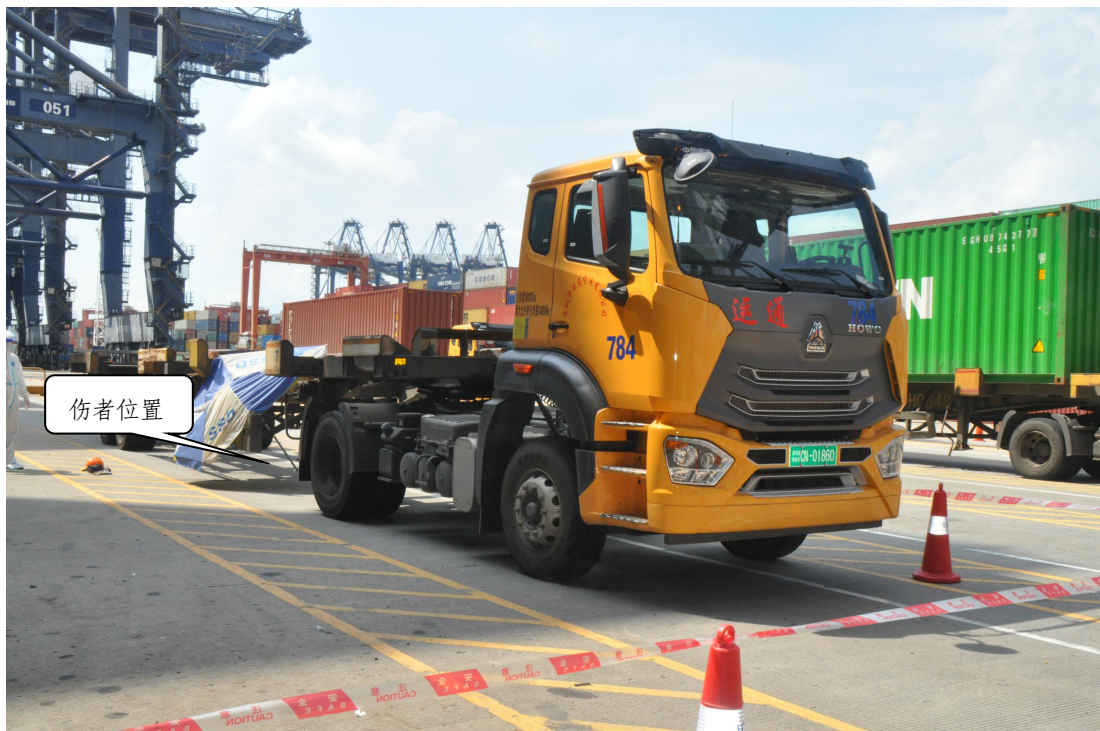
图 5 伤者位置现状图

经现场勘查，肇事车辆位于盐田三期码头 11#泊位的 555#和 554#系缆墩之间，头南尾北停在 51 号吊塔下 2 号车道上。该车辆挂“深圳港场内车 CN-01860”牌照，车架号：LZZPCCMD8MJ217400，发动机标号：210707814767，车辆牵引挂车车架号：LT1CC14226C001200。现场伤者仰躺在挂车下面（靠右侧护栏带下方），头部朝车头方向，距车辆前轮约 4.3m，上身穿反光服，腰身下有一片血迹，腰左侧掉落有一台工作用平板电脑，旁边散落有一顶安全帽，帽扣朝上。现场地面道路临时线、操作线和黄格线清晰，未发现明显刹车痕迹。（见图 5）